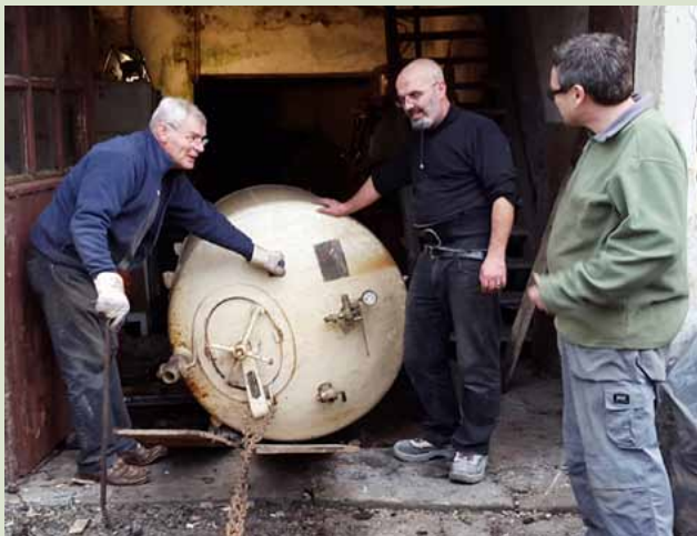
Sortie de tanks de garde d'une brasserie.

- 2.328,85 heures bénévoles travaillées en 2015, dont 10,44 % consacrés aux rénovations, 16,82 % aux recherches historiques et 4,69 % au classement. Le total de 2.328,85 heures ne comporte pas le temps consacré à la chasse aux nouvelles pièces d'exposition. Le grand total d'heures travaillées est maintenant de 27.695,70 heures .