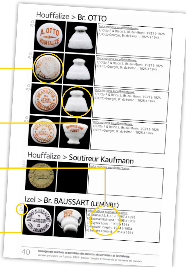
Modèle de page du futur catalogue.

Aide de classement pour les collectionneurs