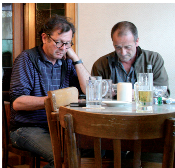
Ci-dessus : le chef décorateur (à gauche) et le responsable de production (à droite) sont en train de préparer les prochaines scènes qui seront tournées pendant la nuit. Ci-dessous : le bistrot qui a été décoré majoritairement avec le matériel de notre musée.