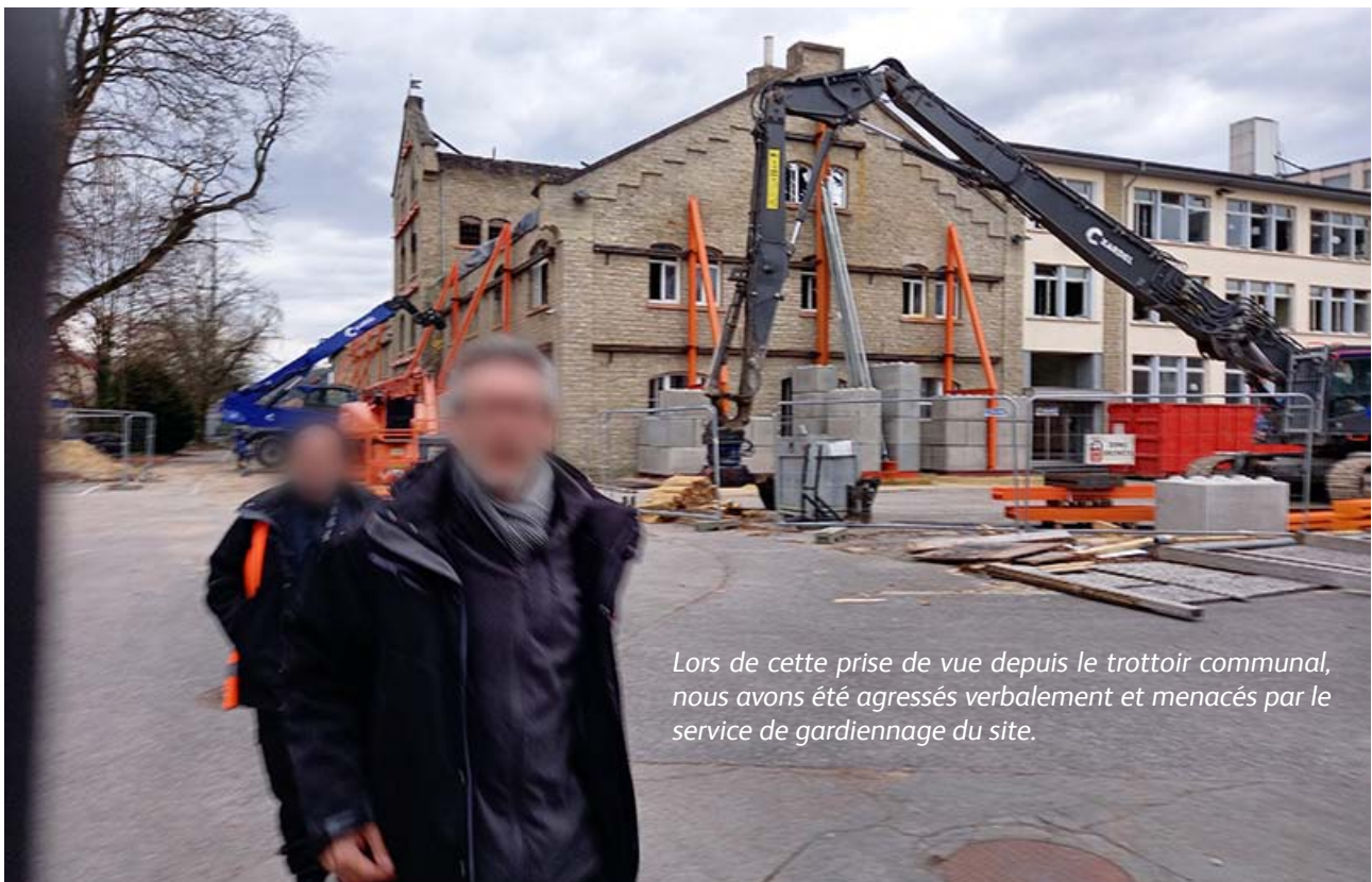
Lors de cette prise de vue depuis le trottoir communal, nous avons été agressés verbalement et menacés par le service de gardiennage du site.

En mars 2022, la « Compagnie de Construction Luxembourgeoise » (CDCL) s'intéresse au projet