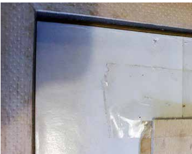
Auf diesem Foto kann man gut die Anomalien erkennen, wie z.B. der neue Rahmen, die Holzplatte, auf welche die Lithographie geklebt wurde, die weißen Streifen vom doppelseitigem Klebeband, sowie ein transparentes Klebeband.

Ein Kollege hat uns ein Photo einer kolorierten Lithographie der Brauerei Funck-Erdmer aus Clausen zugespielt. Wir haben uns also auf die Suche nach diesem ungewöhnlichen Stück gemacht, um es mit jenem aus unserem eigenen Bestand zu vergleichen. Beim ersten Anblick der Lithographie stellten wir fest, dass dieses sich absolut nicht mit unseren Erwartungen deckte – sie war nicht nur wesentlich größer als unsere eigene (81x71 cm im Vergleich zu 47x41 cm, Rahmen einbegriffen), sondern wies zudem eine gewisse Körnung auf, die bei unserer nicht feststellbar war. Wie war ein derart signifikanter Schärfenunterschied möglich, bei einem Druckerzeugnis aus der gleichen Zeit? Ebenfalls stutzig machte uns der Rahmen – die Vorderseite älter, die Rückseite allerdings vergleichsweise neu? Auch die Rückwand aus Karton schien recht neu zu sein. Kurzum: vermutlich eine Kopie, bestenfalls ein Nachdruck. Aber die Besitzerin schwor Stein und Bein der Rahme hänge bereits seit 70 Jahren im Salon ihrer Gaststätte. Um der Sache auf den Grund zu gehen erwies es sich also als unumgänglich eine „Autopsie“ an dem Patienten vorzunehmen.