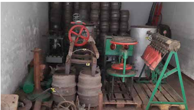
Mehr als 100 Fässer konnten vor der Entsorgung gerettet werden. Auf diesem Bild kann man den kleinen Fassschlitten sehen, der auf die Eisenfässer im Vordergrund steht.

Das so vor der Witterung gerettete Material steht nun wieder im Trocknen und wartet darauf renoviert und ausgestellt zu werden.