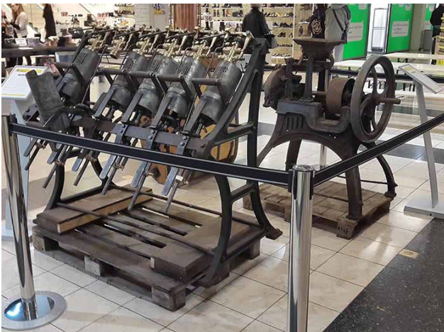
Eine renovierte Abfüllanlage und eine Malzmühle aus der Brauerei Pierrard (Mellier).

Viele Mitglieder waren mit ihren Bieren vor Ort, wie zum Beispiel Den Heischter, Clausel, Funck-Bricher, Bonnevoie, Béierhaascht, Bare Brewing, Château de Wiltz, sowie die Gambrinus-Bruderschaft. Auch unser Verein wurde gebeten, Dekoration für diese Veranstaltung zur Verfügung