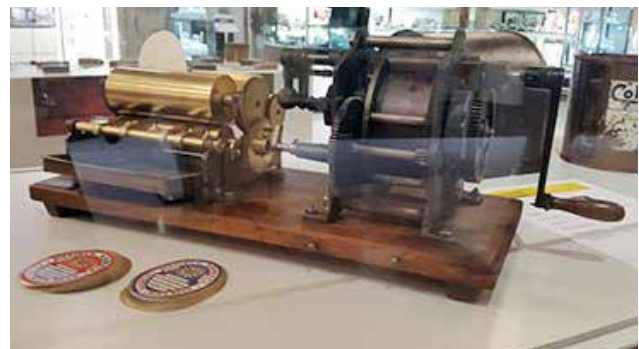
Die renovierte Etikettiermaschine (Anfang 20. Jahrhundert).