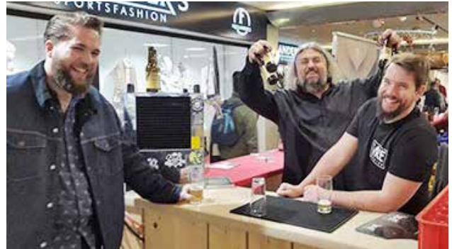
Der Preis für die beste Stimmung ging zweifelsfrei an Bare Brewing.

Eine andere Vitrine zeigte eine Maschine zum Aufkleben von Etiketten, welche gegen 1900 in Deutschland hergestellt wurde. Es handelt sich hierbei um ein äußerst interessantes Gerät, in Anbetracht ihres Mechanismus auf Basis von Federn und ihrer Seltenheit. Auch zahlreiche Besucher waren von diesem Gerät erstaunt.