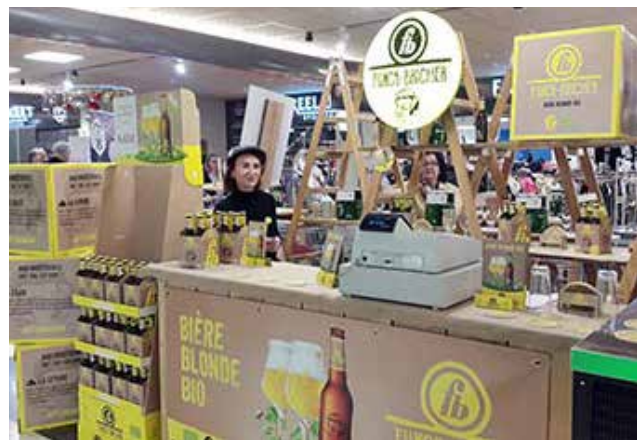
Der professionelle Stand von Funck-Bricher.