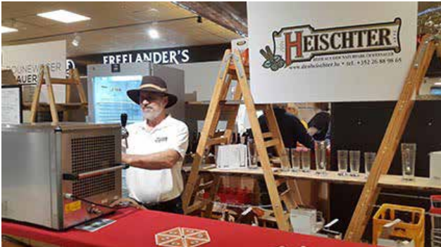
Der Chef am Zapfhahn.