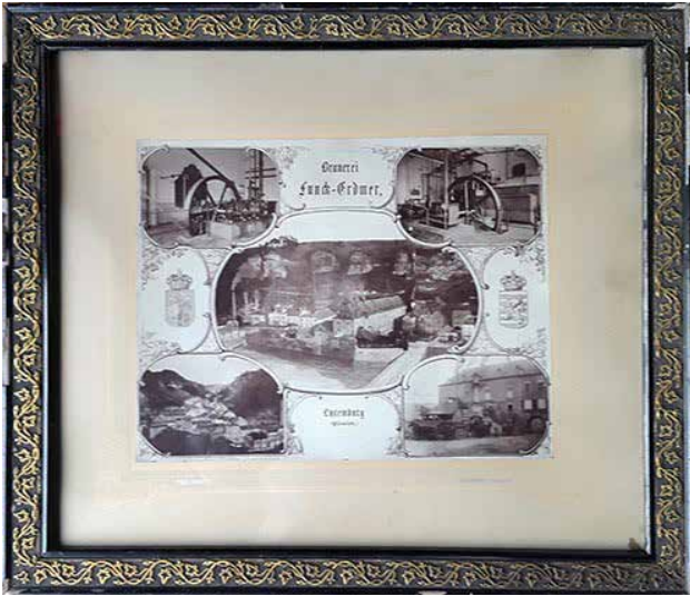
Die originale Fotomontage aus unserer Sammlung.

gleichen doppelseitigen Klebebändern unmittelbar an der Lithographie befestigt, die wir bereits zuvor gesehen hatten.