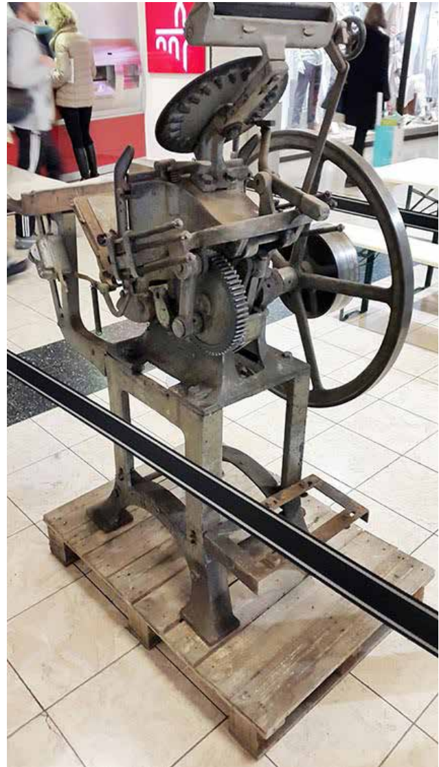
Die Bierdeckel-Druckpresse, auf der die Platten montiert werden konnten.

zu stellen. Zahlreiche Maschinen der Brauerei Pierrard aus Mellier wurden ausgestellt, die durch Werbematerial aus unserem Bestand ergänzt wurden. Der Schwerpunkt wurde hierbei auf kleine Druckerzeugnisse gelegt, so dass eine Bierdeckel-Druckpresse aus der Druckerei Palgen aus Esch-Alzette ausgestellt wurde, begleitet von Original-Druckplatten, sowie einigen Enderzeugnissen.