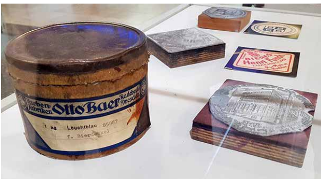
Druckplatten, sowie ein Topf blauer Spezialfarbe für Bierdeckel.