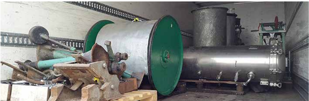
Die erste Ladung im Munhowen-Laster umfasste Transportcontainer für Hopfen, eine mobile Schmiede, ein Transportwagen für Malz, Teile einer Fass-Abfüllanlage, sowie mehrere lose Teile.