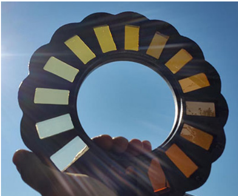
La roulette à tonalités, démontée et tenue contre la lumière.