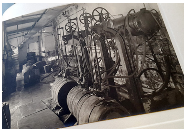
Le soutirage en tonneaux.