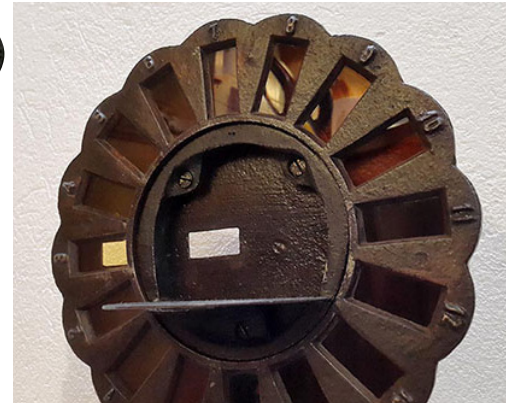
La face avant de l'outil.