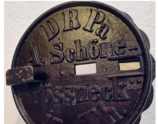
Le « côté obscur » du colorimètre.