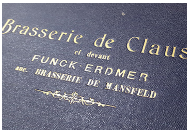
La couverture de l'album de photos.