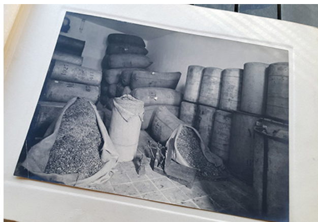
Le grenier à houblons.