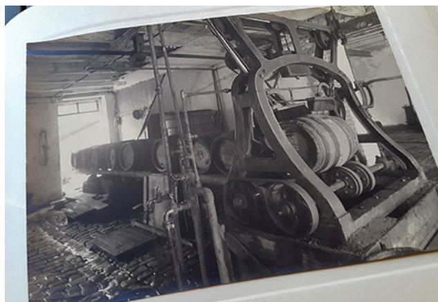
L'installation de nettoyage de tonneaux, appelée « Wix » en Luxembourgeois.