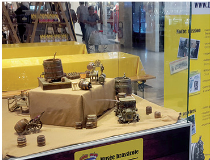
Notre brasserie miniature, qui représente les différentes activités du brasseur jusqu'à la livraison, a particulièrement attiré les regards des enfants.