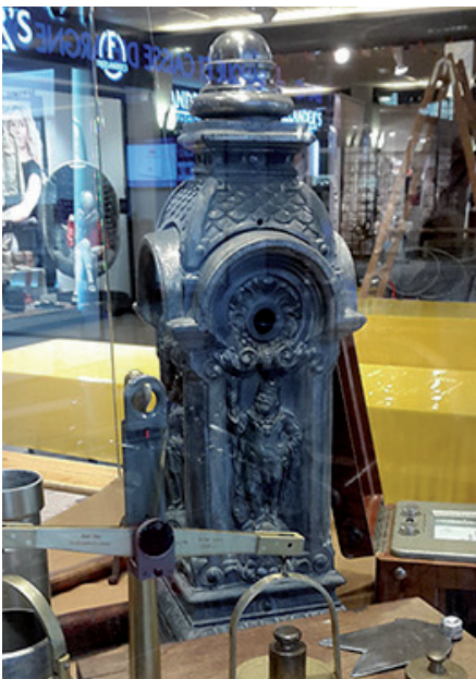
La pièce phare de cette vitrine était la pompe à bière en fonte à l'effigie de Gambrinus, datant probablement des années 1880.