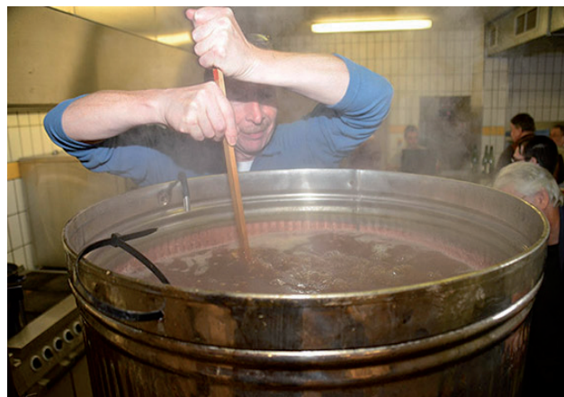
Miraculix avec son chaudron ...

La suite consistait en une conférence sur la brasserie luxembourgeoise par Yves Claude pendant laquelle les orateurs pouvaient plonger dans les activités brassicoles luxembourgeoises d'avant 1914.