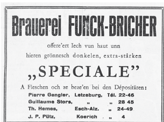
Annonce publicitaire de 1950 informant la clientèle où elle pouvait trouver des dépositaires des bières Funck-Bricher.