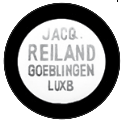
Le bouchon en porcelaine Reiland sur fond noir.